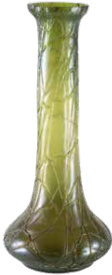
88 VASO ART NOUVEAU IN VETRO IRIDESCENTE Austria, XX Sec. soffiato a mano nella tonalità del verde con applicazioni in pasta vitrea h. 44 cm.