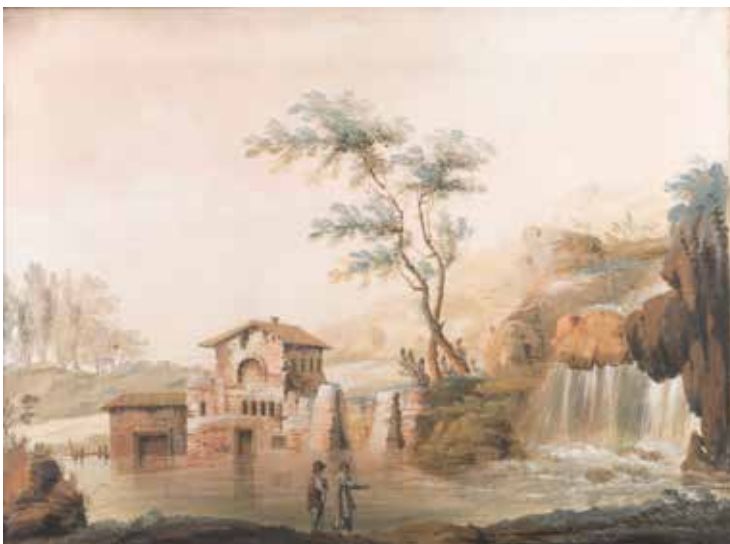
158 PITTORE DEL GRAN TOUR attivo fine XVIII - inizio XIX Sec. "Paesaggio con cascata e figure", tempera su carta applicata su tela, entro cornice 44x58,5 cm.