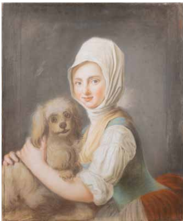
136 SCUOLA FRANCESE XVIII Sec. "Giovane contadina con cagnolino", pastello su tela, entro cornice 73x61 cm.