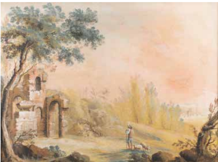
157 PITTORE DEL GRAN TOUR attivo fine XVIII - inizio XIX Sec. "Paesaggio con architetture e figure", tempera su carta applicata su tela, firmata 1803 in basso a destra, entro cornice 44x58,5 cm.