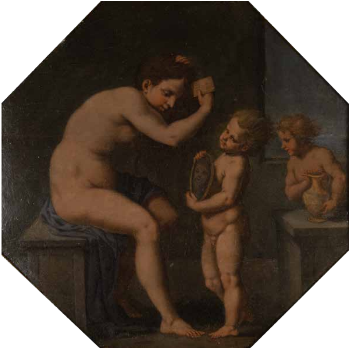
142 SCUOLA FIORENTINA inizio XVII Sec. "Toiletta di Venere", olio su tavola, entro cornice 46,5x48 cm.