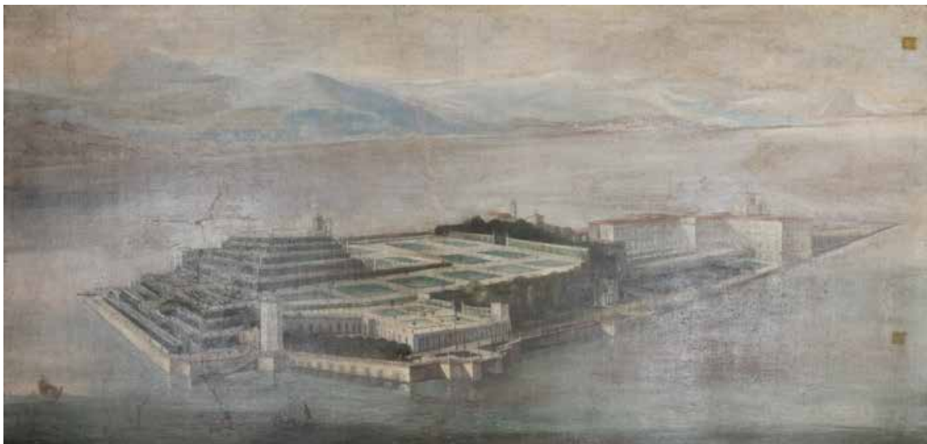
163 PITTORE ATTIVO NELL'ITALIA SETTENTRIONALE XVIII Sec. "L'isola Bella sul lago Maggiore", olio su tela, entro cornice 74x152 cm.