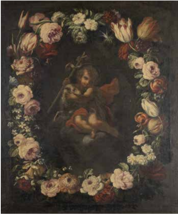
127 MARIO NUZZI DETTO MARIO DEI FIORI, CERCHIA DI XVII Sec. "San Giovannino in ghirlanda di fiori", olio su tela, entro cornice 74x62cm.