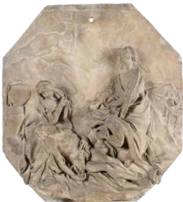
26 AMBITO ROMANO fine XVII - inizio XVIII Sec. "Compianto sul Cristo morto", altorilievo in terracotta 46x41x10 cm.