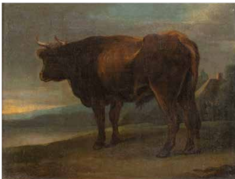
103 NICOLAES PIETERSZ BERCHEM, ATTRIBUITO Haarlem 1620 - Amsterdam 1683 "Bovino con sfondo di paesaggio", olio su tela, entro cornice 31x38 cm.