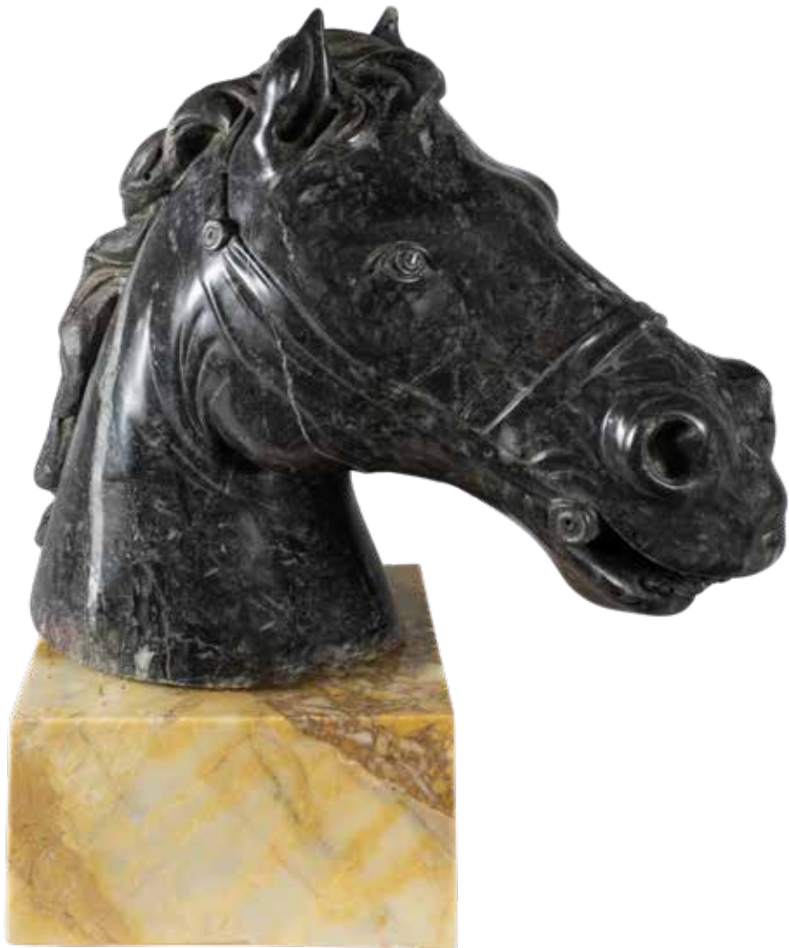
44 SCULTURA IN MARMO BIGIO ANTICO Italia, XX Sec. raffigurante testa di cavallo, poggiate su base in marmo giallo Siena 54x50x20