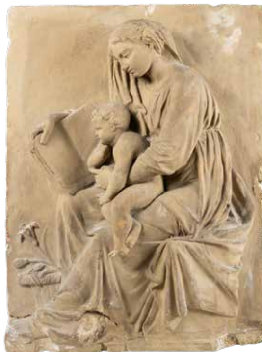
27 SCULTORE ITALIANO XIX Sec. "Madonna con bambino", altorilievo in terracotta, lievi difetti 55x42x13 cm.