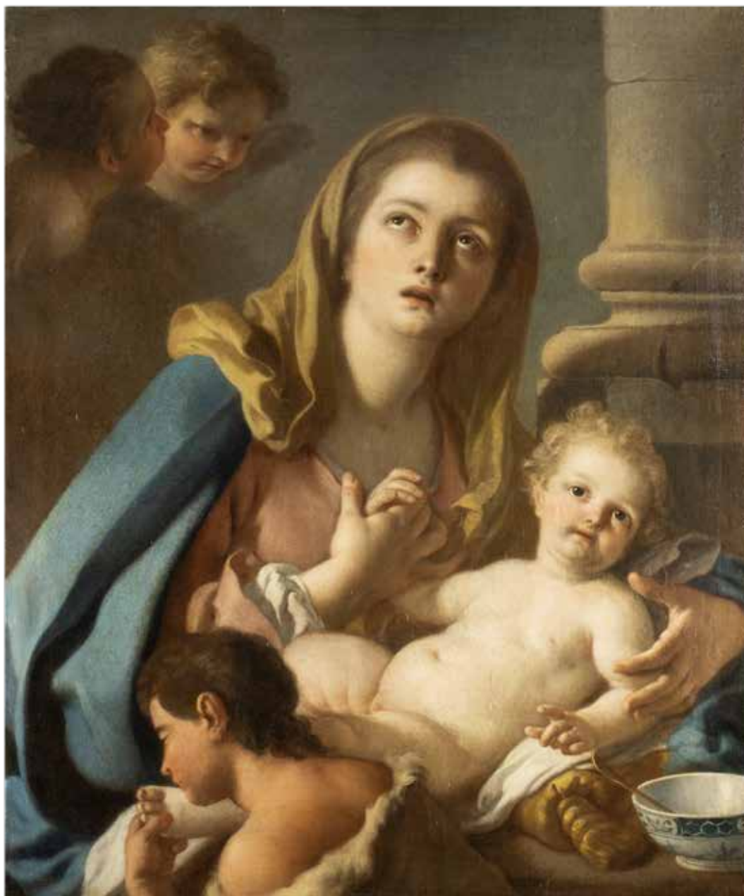
124 FRANCESCO DE MURA Napoli 1696 – 1782 "Madonna con Bambino e San Giovannino", olio su tela, entro cornice 76x63 cm. € 4.000/6.000