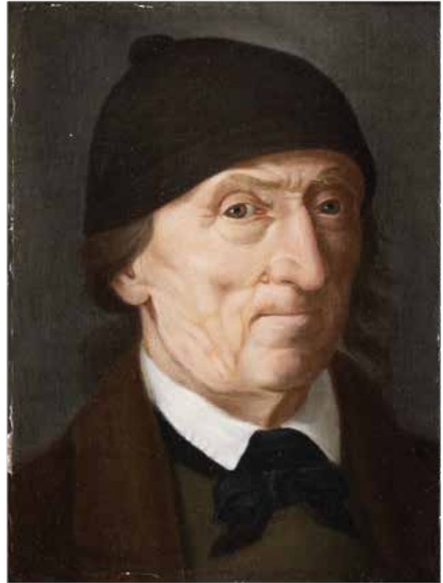
139 PITTORE NORD EUROPEO XVII - XVIII Sec. "Ritratto maschile", olio su tela, entro cornice 30x22,5 cm.