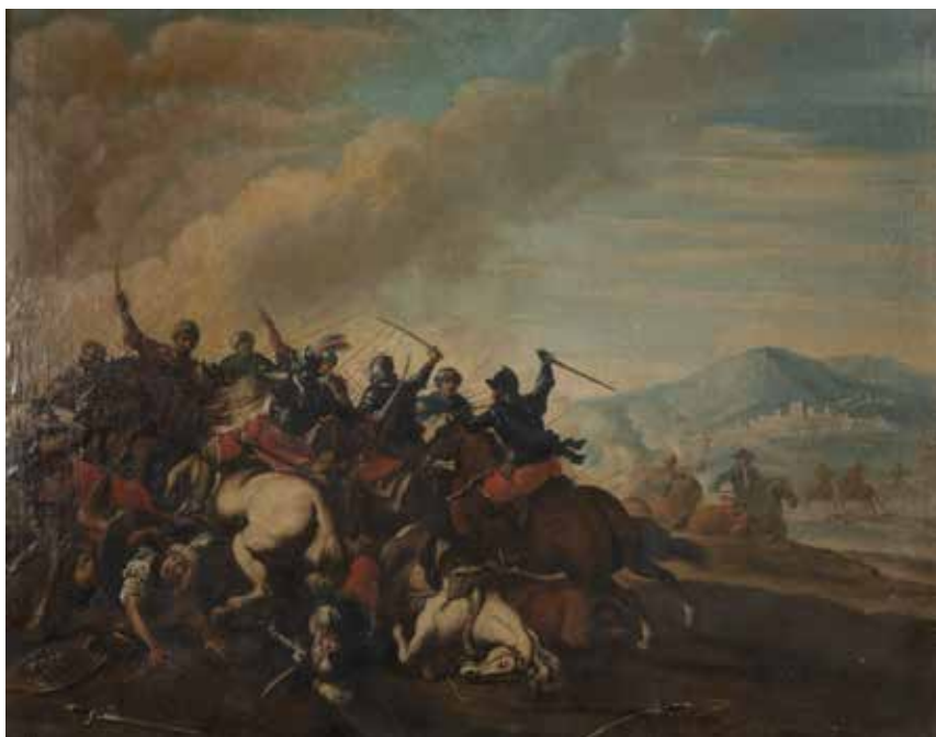
105 ANTONIO CALZA, SEGUACE DI XVIII Sec. "Battaglia tra cristiani e ottomani", olio su tela, entro cornice 51,5x64,5 cm.