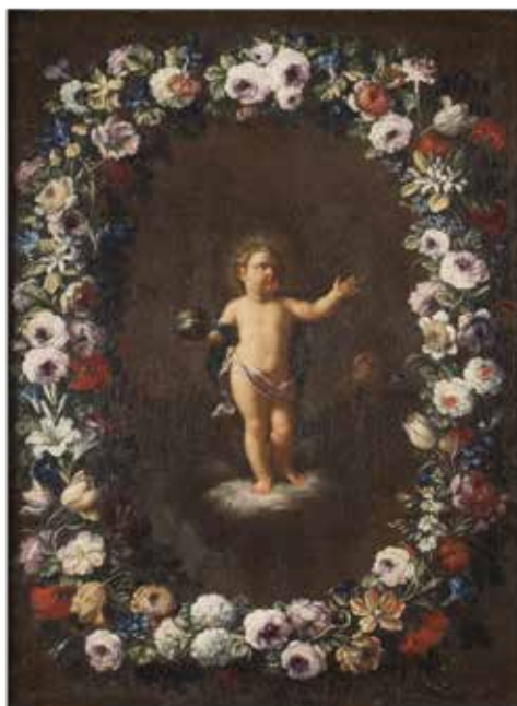
129 MARIO NUZZI DETTO MARIO DEI FIORI, SEGUACE DI XVIII Sec. "Bambino Gesù e San Giovannino in ghirlanda di fiori", coppia di oli su tela, entro cornici 40x30,5 cm.