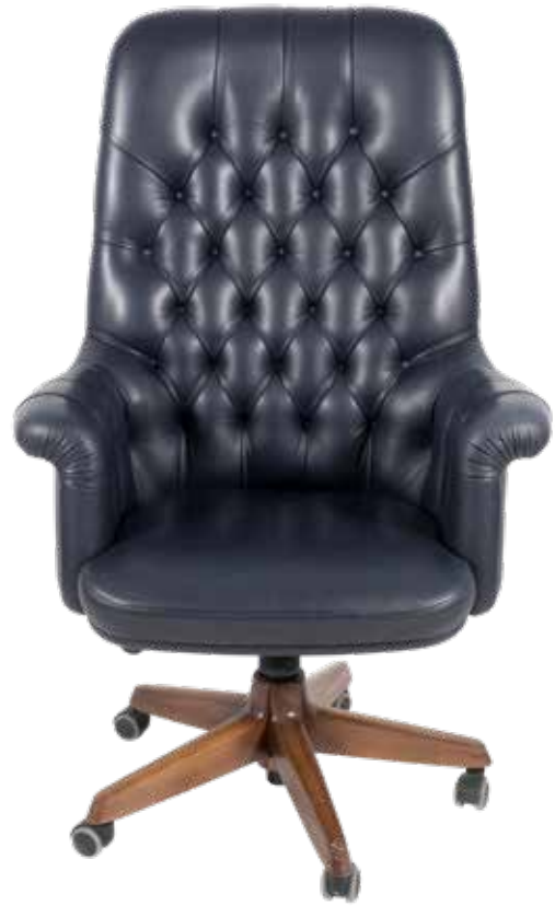
94 PROD. POLTRONA FRAU Italia, XX Sec. poltrona da ufficio girevole e regolabile mod. Oxford President in pelle nera con base in legno di faggio provvista di rotelle, etichetta della produzione, segni di usura 125x72x52 cm.