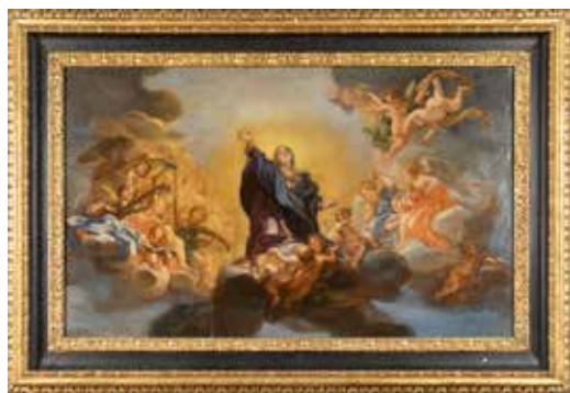
120 ANDREA SACCHI, CERCHIA DI seconda metà del XVIII Sec. "Vergine in Gloria", olio su tela, entro cornice 52x86 cm.