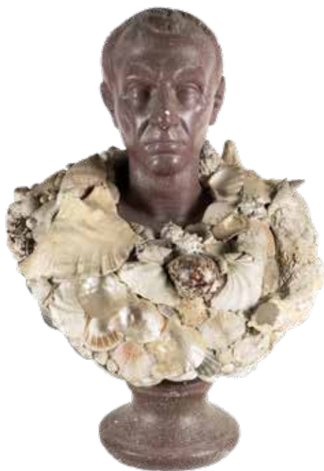
96 BUSTO IN GESSO A FINTO PORFIDO XX Sec. raffigurante Imperatore romano su base circolare, rivestito con conchiglie, usure e mancanze 63x44x35 cm.