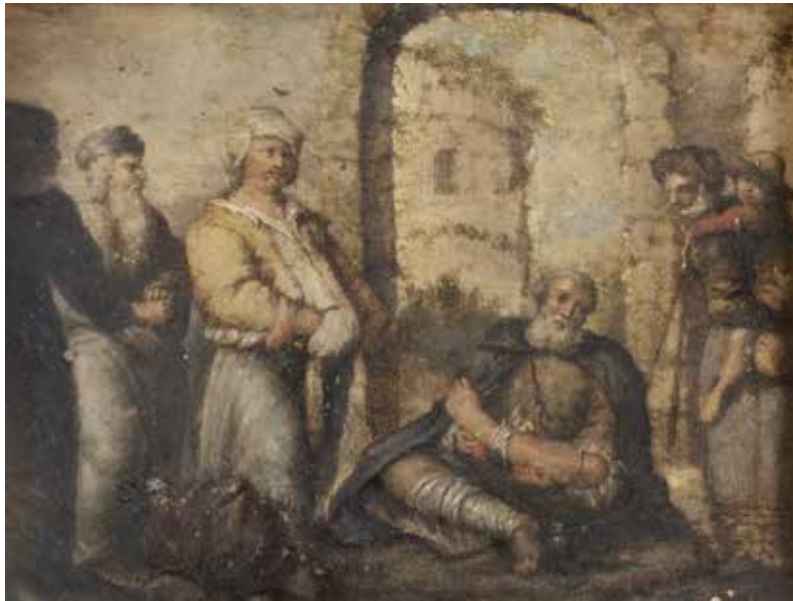
165 SCUOLA ITALIANA XVII - XVIII Sec. "La pazienza di Giobbe", olio su rame, entro cornice 17,5x23 cm.