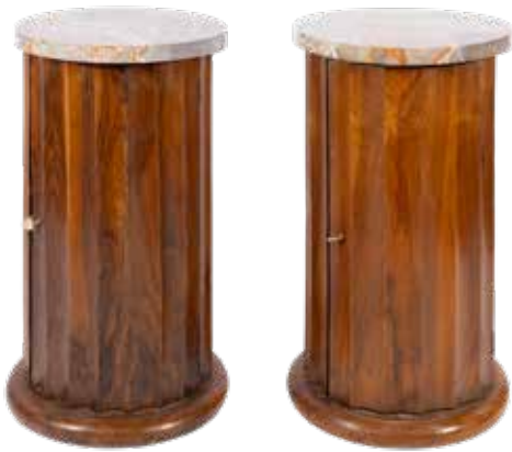
34 COPPIA DI COMODINI A COLONNA SCANALATA IN LEGNO E MARMO Italia, XIX - XX Sec. sezione circolare con sportello frontale, usure 75x29 cm.