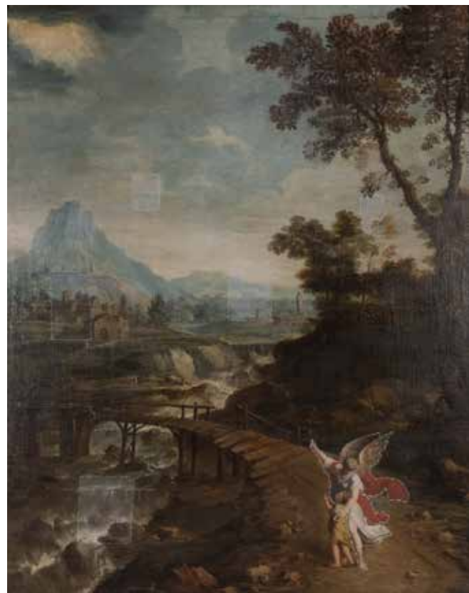
126 GIUSEPPE ZOLA Brescia 1672 – Ferrara 1743 "Tobia e l'Angelo", olio su tela, entro cornice. 144x115 cm.