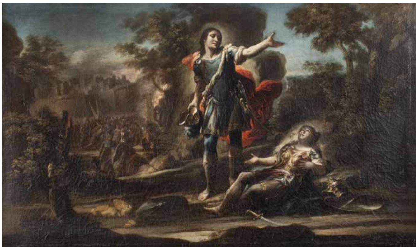
114 SCUOLA ITALIANA fine XVII - inizi XVIII Sec. "Tancredi e Clorinda", olio su tela, entro cornice 62x102 cm.