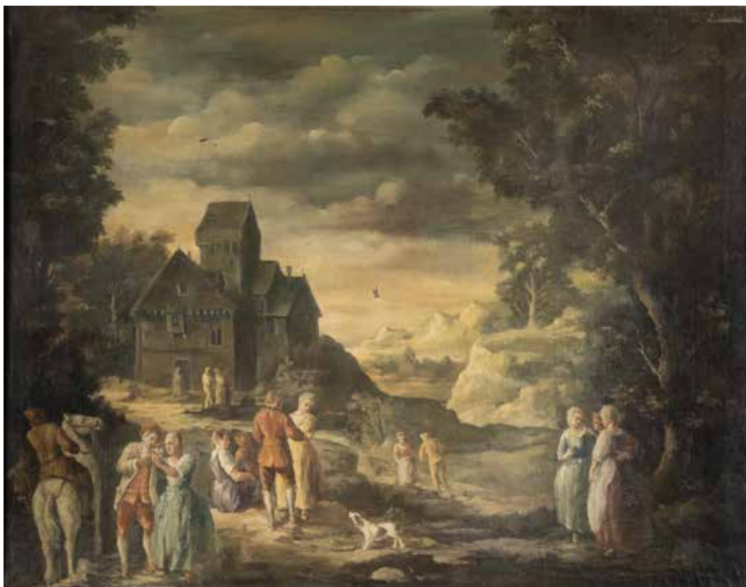
108 SCUOLA FRANCESE XVIII Sec. "Scena campestre", olio su tela, entro cornice 92x117 cm. € 800/1.000