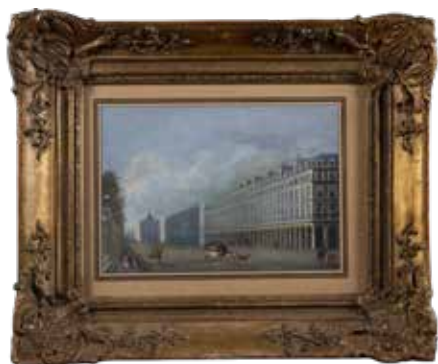
161 GIUSEPPE CANELLA Verona 1788 - Firenze 1847 "Rue de Rivoli, Parigi", 1860, olio su carta, firmato e datato in basso a sinistra, entro cornice 18,5x26,5 cm.