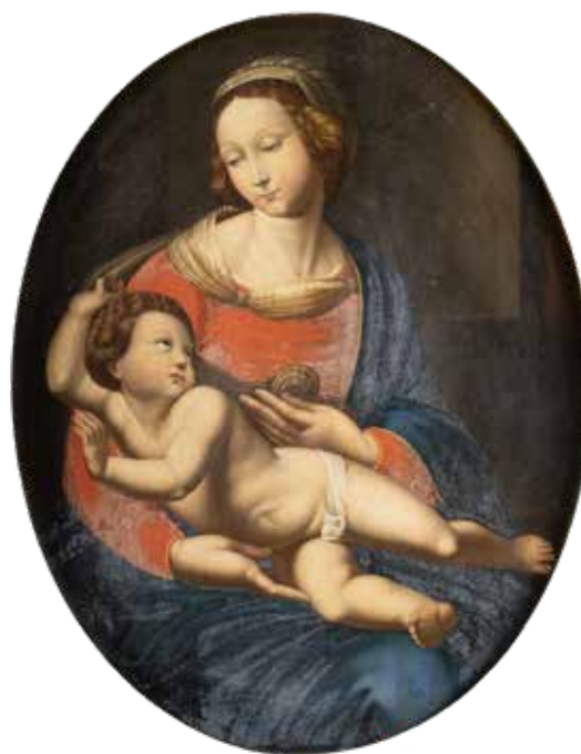
122 RAFFAELLO SANZIO, COPIA DA XIX Sec. "Madonna Bridgewater", olio su tela, entro cornice 63,5x51,5 cm.