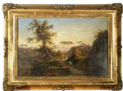
173 ALESSANDRO LA VOLPE Lucera 1820 – Roma 1887 "Paesaggio con contadina e rovine", olio su tela, firmato in basso a sinistra, entro cornice 42x64 cm.