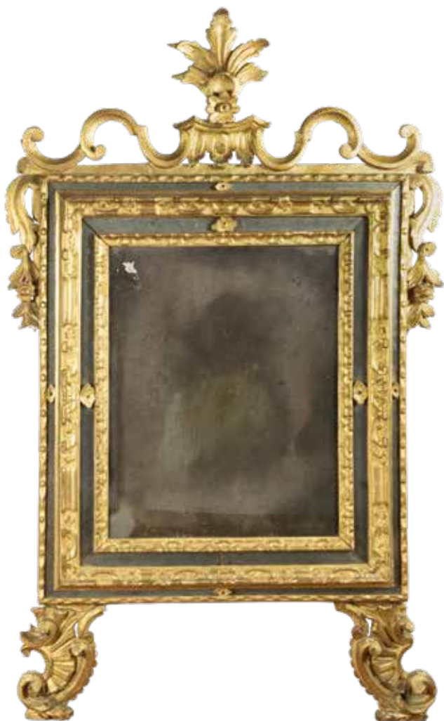
75 SPECCHIERA IN LEGNO INTAGLIATO E DORATO Piemonte, XVIII Sec. cornice rettangolare a doppia cornice su piedi a ricciolo, decoro a motivo floreale e volute, cimasa mistilinea centrata da motivo naturalistico, usure e difetti 138x83 cm.