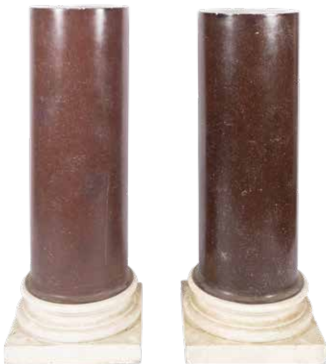
98 COPPIA DI COLONNE IN LEGNO LACCATO A SIMULARE IL PROFIDO XX Sec. base squadrata, usure e difetti 120x44,5x44,5 cm.