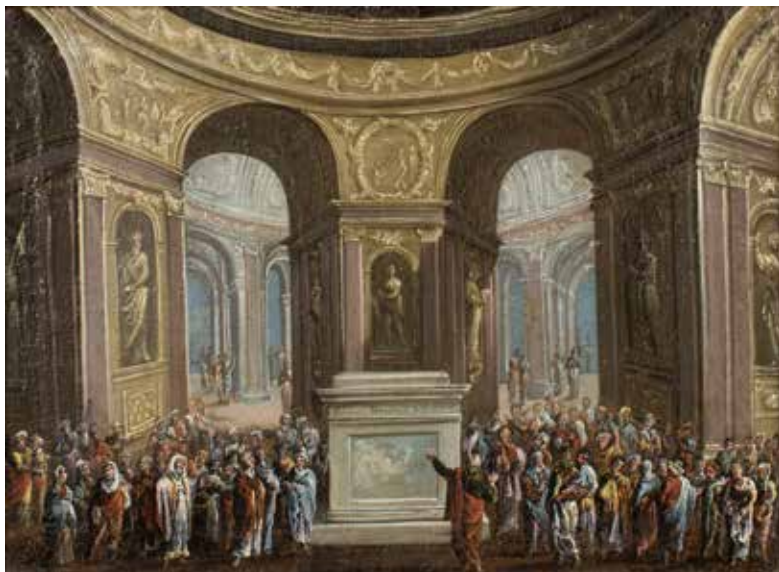
113 GHERARDO POLI Firenze 1676 - Pisa post 1739 "La predica di San Paolo ad Atene", olio su tela, entro cornice 24x33 cm.