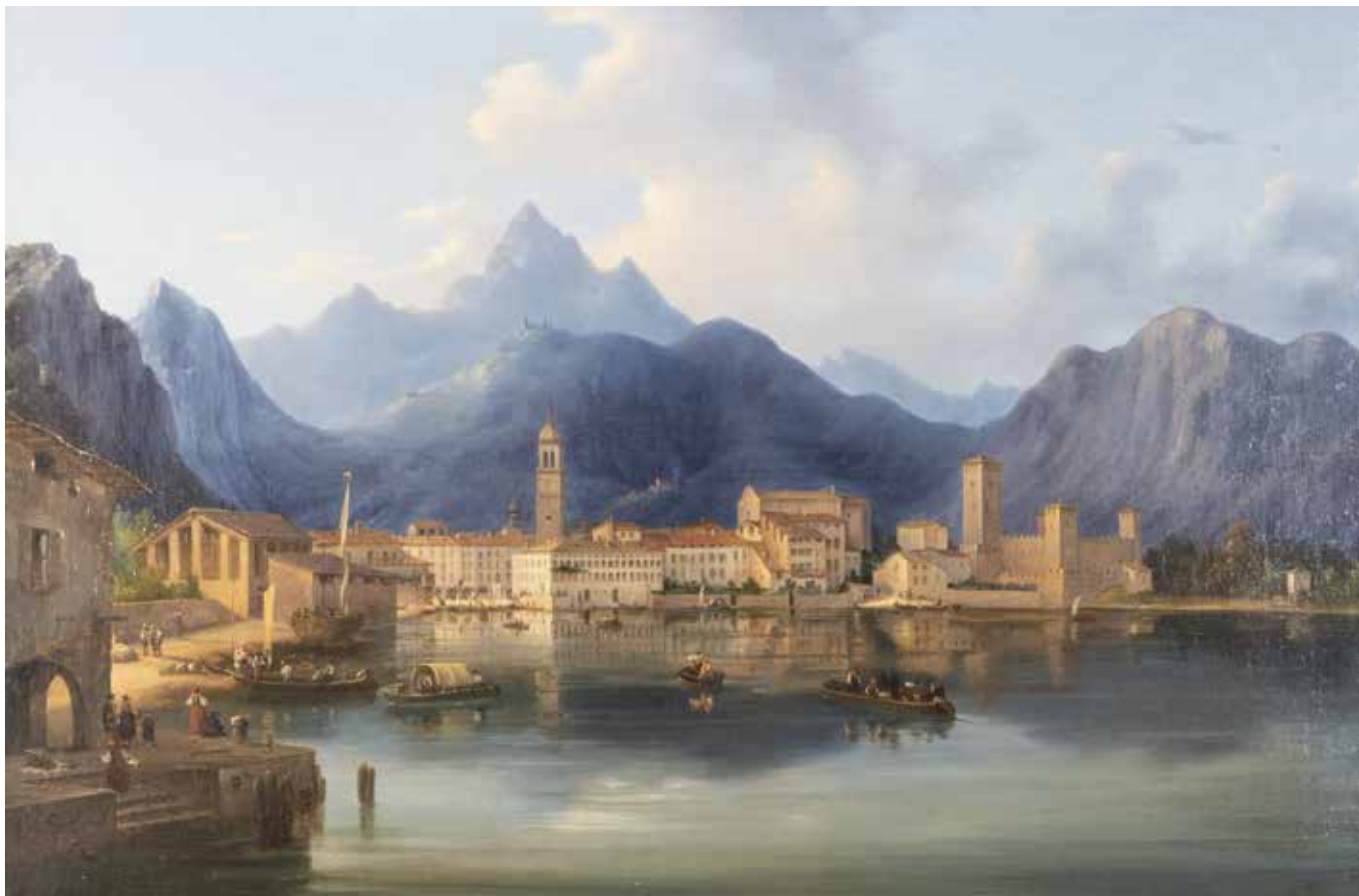
164 SCUOLA TEDESCA primi del XIX Sec. "Riva del Garda", olio su tela, entro cornice 56,5x81,5 cm.