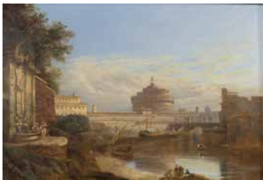
178 PITTORE ATTIVO A ROMA XVIII - XIX Sec. "Veduta di Roma con Castel Sant'Angelo e il Tevere", olio su tavola, entro cornice 24x34,5 cm.