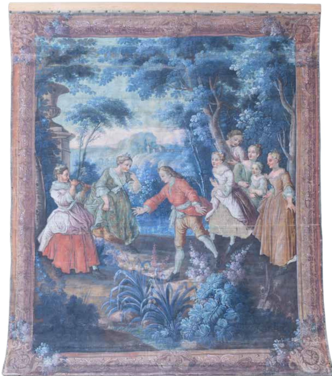
66 ARAZZO FRANCESE XVIII - XIX Sec. raffigurante una scena galante su fondo di paesaggio campestre, usure 265x216 cm.