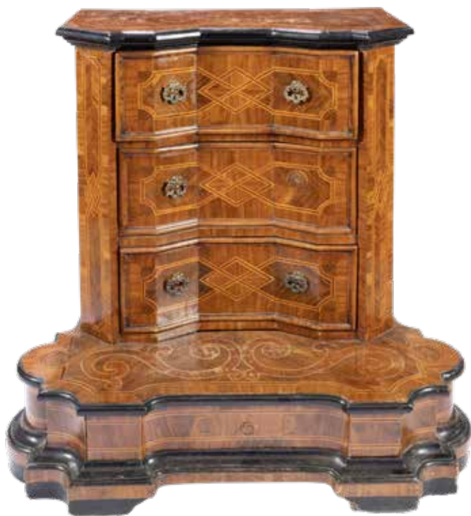
21 INGINOCCHIATOIO INTARSIATO IN LEGNI VARI Lombardia, XVIII Sec.

fronte a tre cassetti con cornici mistilinee in legno ebanizzato, decorazioni a motivi geometrici, predella sagomata con un cassetto, usure e mancanze 89x88x58 cm.