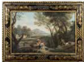
154 GIOVANNI BATTISTA BUSIRI (1698 - 1757) "Scene campestri con figure", coppia di oli su tela, entro cornici 26,5x41 cm.