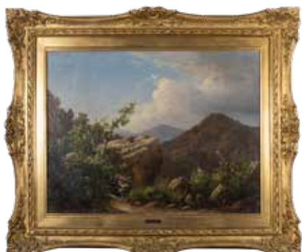
174 CARLO MARKO IL GIOVANE Pest 1822 - Mosca 1891 "Paesaggio con contadina", 1879, olio su tela, firmata e datato in basso a destra, entro cornice 47x62 cm.