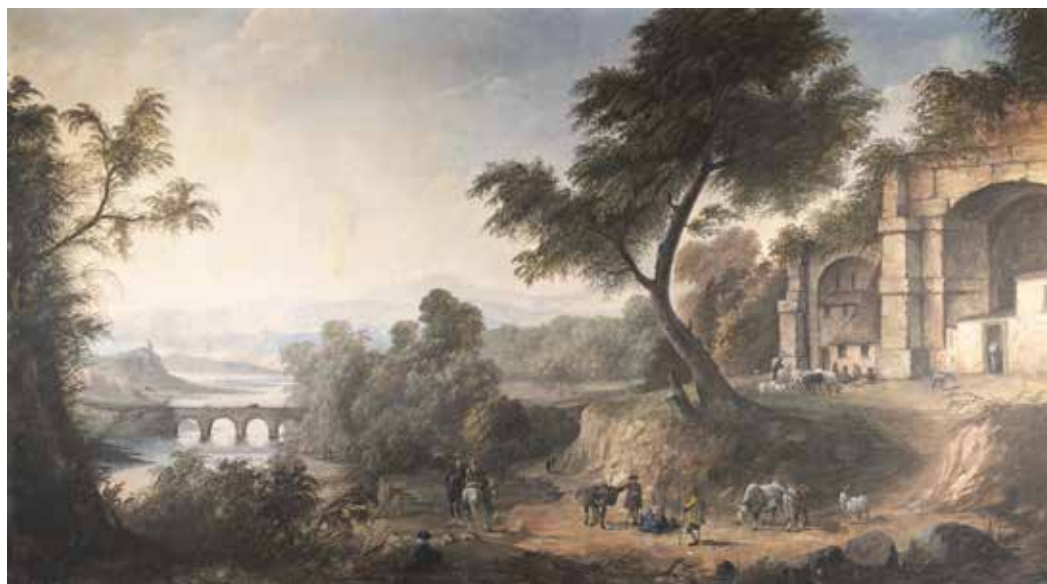
183 PITTORE ATTIVO A ROMA XIX - XX Sec. "Paesaggio con figure e rovine", olio su tela, entro cornice 116x205 cm.