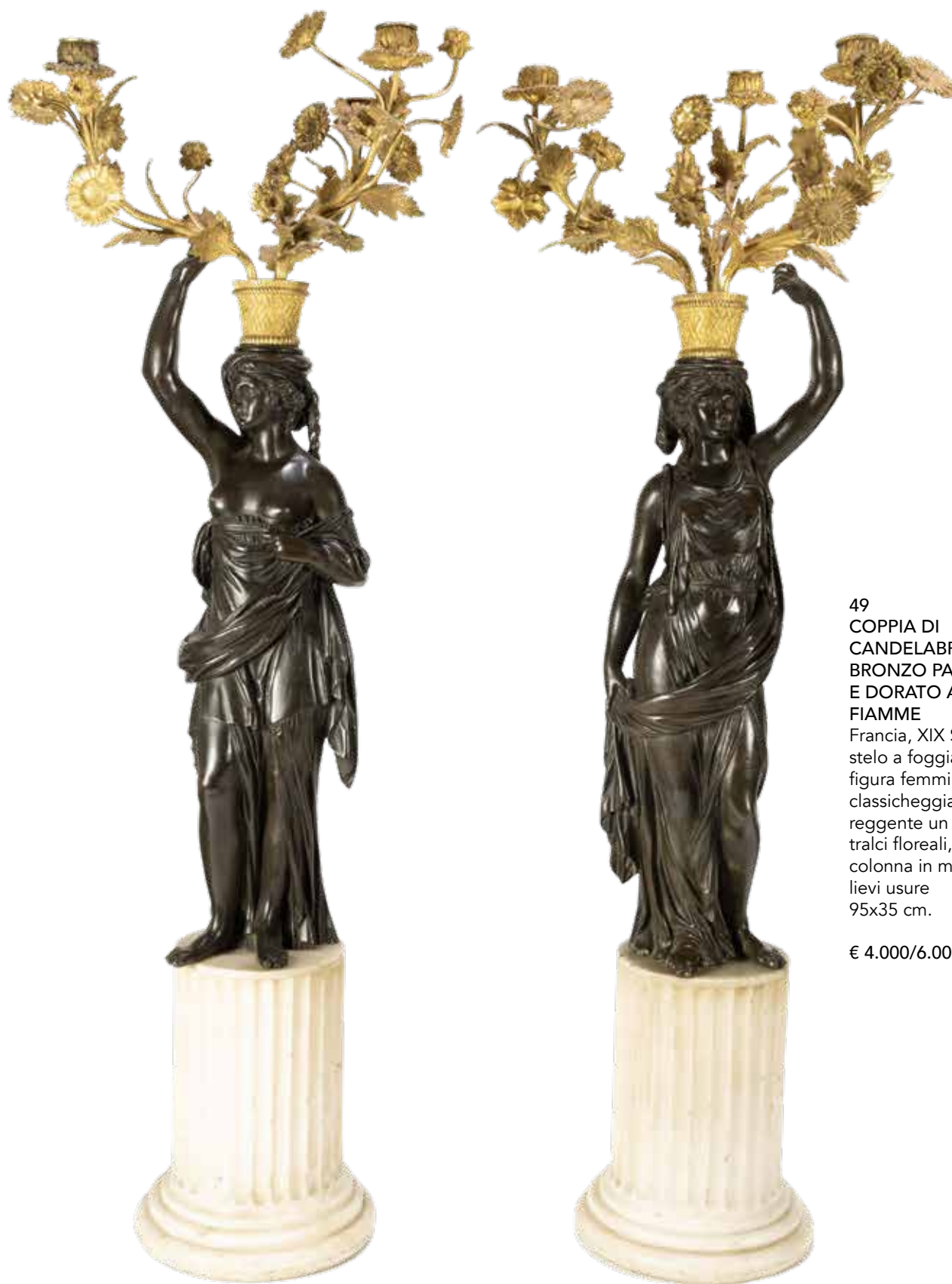
49 COPPIA DI CANDELABRI IN BRONZO PATINATO E DORATO A TRE FIAMME Francia, XIX Sec. stelo a foggia di figura femminile classicggiante reggente un vaso con tracchi floreali, base a colonna in marmo, lievi usure 95x35 cm.