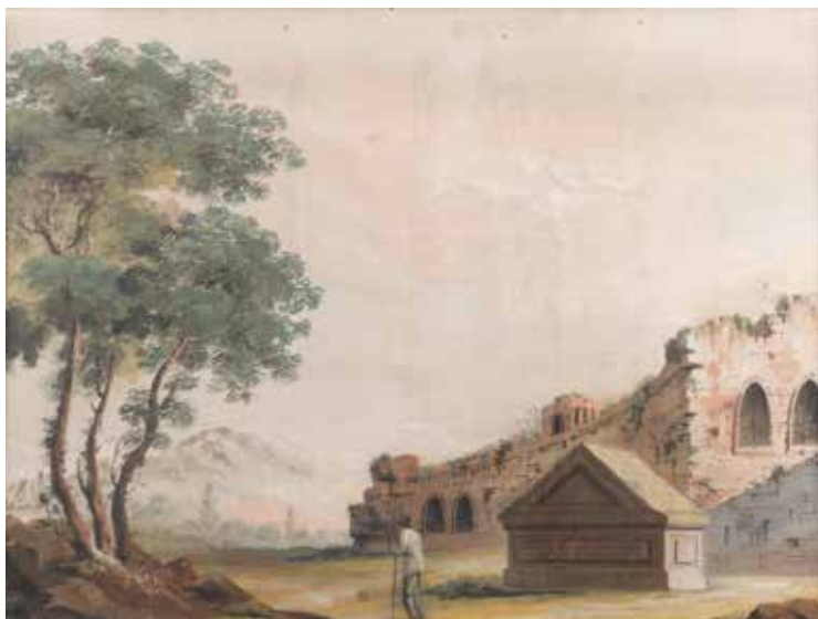
159 PITTORE DEL GRAN TOUR attivo fine XVIII - inizio XIX Sec. "Paesaggio con architetture e viandante", tempera su carta applicata su tela, entro cornice 44x58,5 cm.