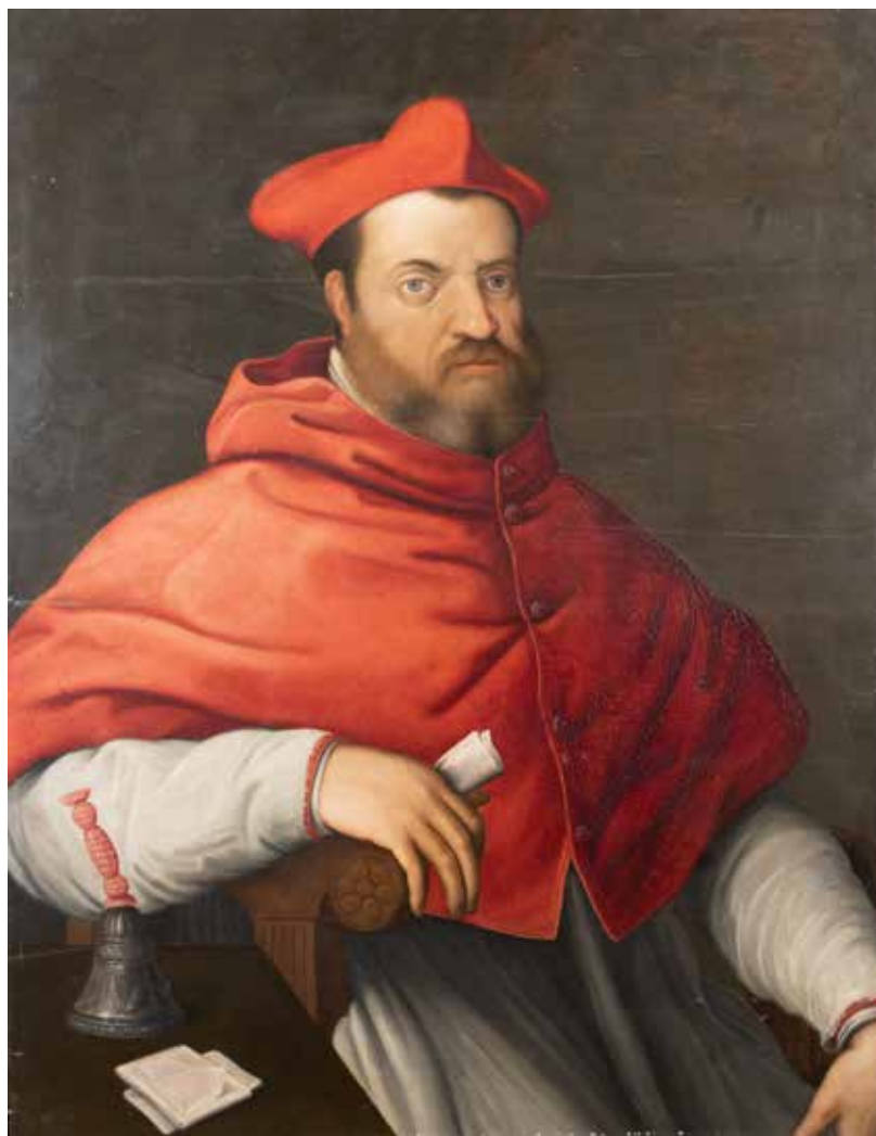
133 FRANCESCO SALVIATI, BOTTEGA DI fine XVI Sec. "Ritratto del cardinale Bernardo Salviati", olio su tavola. 96.5x76 cm.

Provenienza: Collezione Salviati, Firenze (come da catalogo della Fondazione Federico Zeri); Roma, Finarte, 11 novembre 1980, Asta n. 352; Collezione privata romana