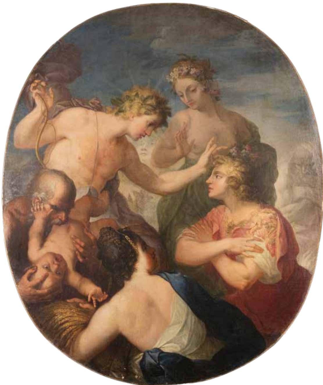
143 SCUOLA ROMANA XVII - XVIII Sec. "Allegoria delle stagioni", olio su tela 137x116 cm.