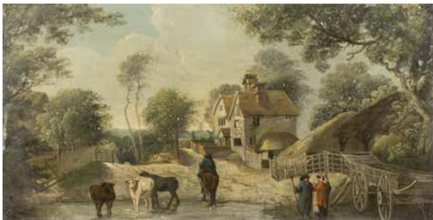
181 SCUOLA INGLESE XVIII Sec. "Paesaggio campestre con figure", olio su tavola 29x57 cm.