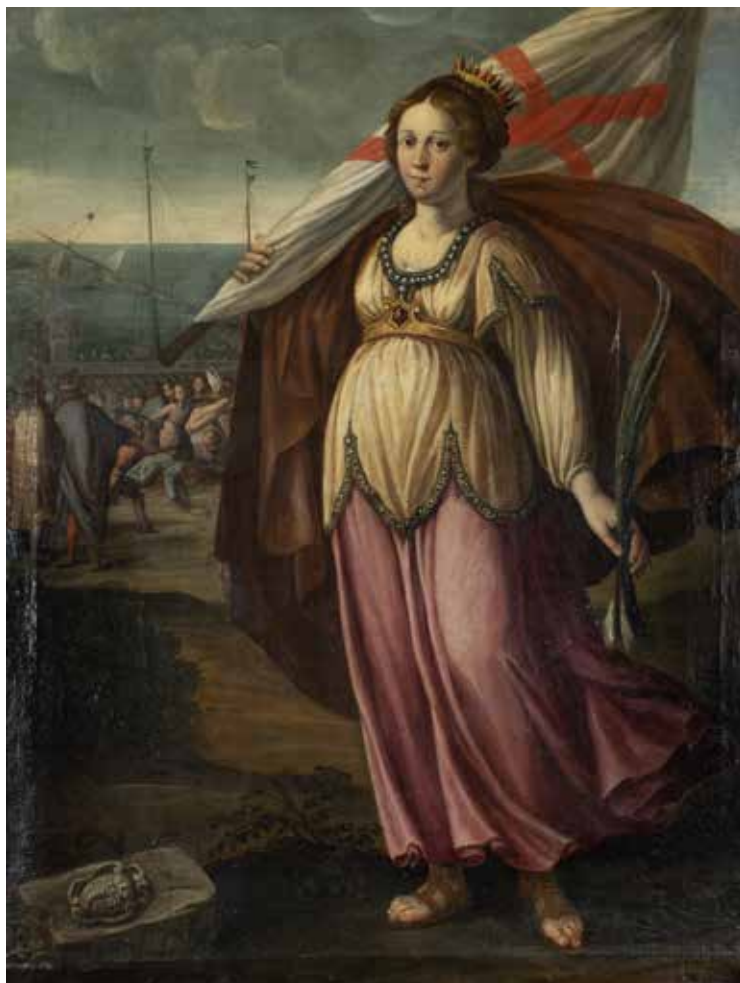
141 PITTORE DELL'ITALIA CENTRALE XVII - XVIII Sec. "Sant'Orsola", olio su tela, entro cornice 96x74 cm.