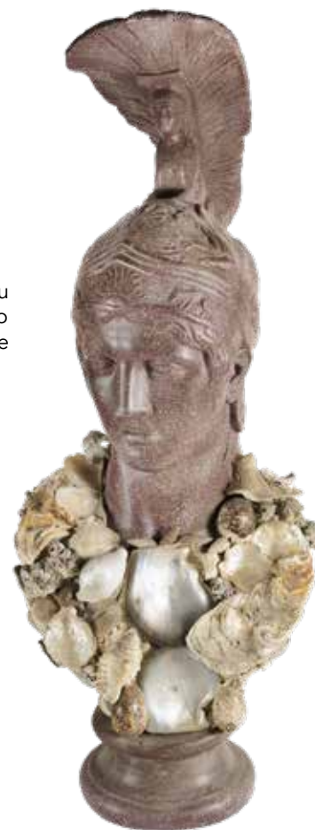
97 BUSTO IN GESSO A FINTO PORFIDO XX Sec. raffigurante Minerva su base circolare, rivestito con conchiglie, usure e mancanze 93x45x35 cm.