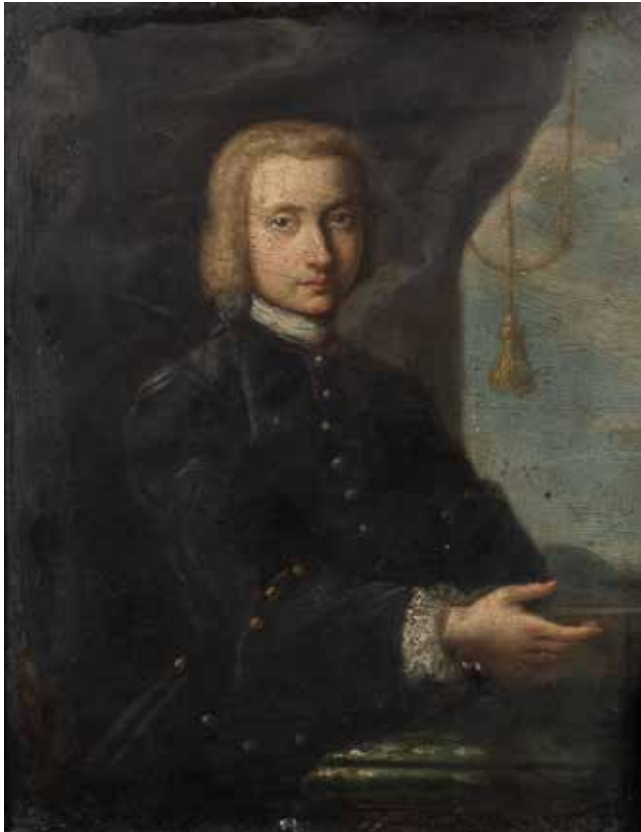
138 SCUOLA INGLESE XVII - XVIII Sec. "Ritratto di gentiluomo", olio su rame, entro cornice 23x17 cm.