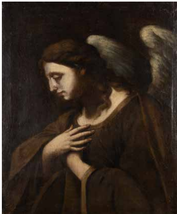
112 SCUOLA EMILIANA XVII Sec. "Angelo in preghiera", olio su tela, entro cornice 74,5x61 cm.