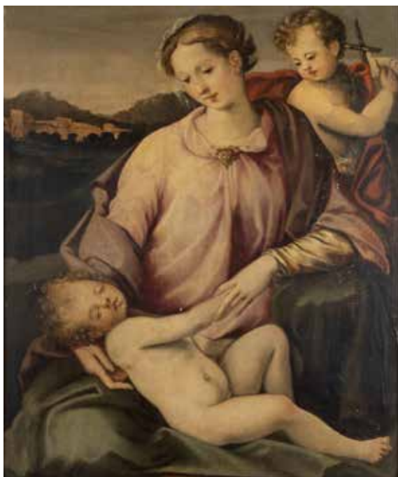
121 SCUOLA TOSCANA XVI Sec. "Madonna con Bambino e San Giovannino", olio su tavola, entro cornice 56,5x44,5 cm.