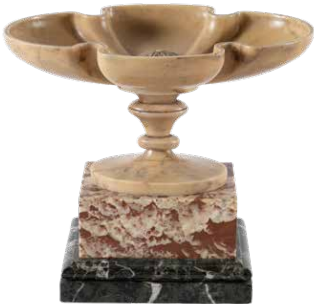
3 ALZATA IN MARMO GIALLO ANTICO Italia, XIX - XX Sec. vasca ovale con profilo mosso e rosetta centrale al centro, poggiante su base squadrata in marmi diversi 16,5x18,5x12,5 cm.