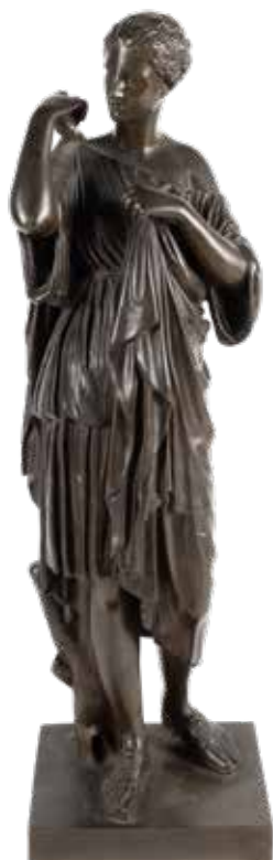
64 FONDERIA FERDINAD BARBEDIENNE, SCULTURA IN BRONZO PATINATO Francia, XIX Sec. raffigurante la Diana di Gabi, firmata F. Barbedienne fondeurs con marchio sul retro 9,5x39 cm.