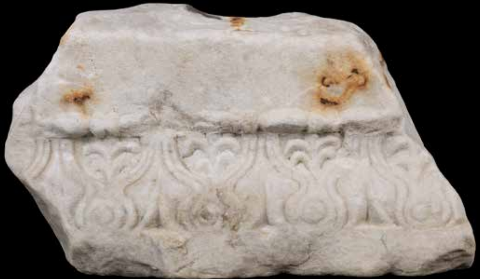
ELEMENTO ARCHITETTONICO Da Lanuvio, Villa Frediani Dionigi Marmo Bianco 15x28x9 cm.