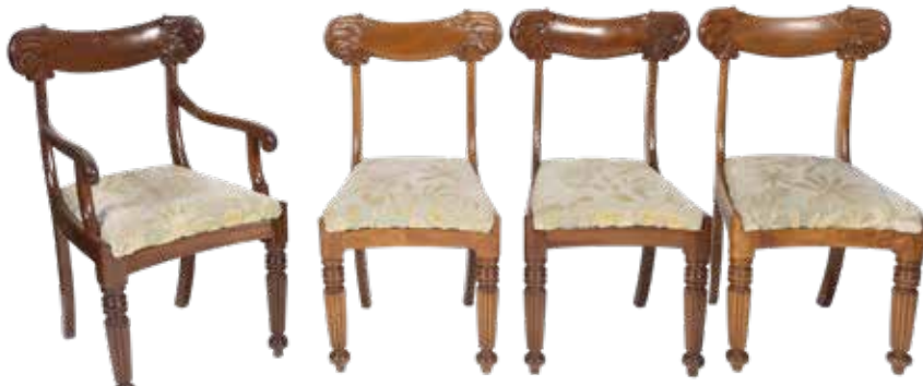
36 SEI SEDIE E DUE POLTRONE IN MOGANO XIX - XX Sec. schienale a fascia orizzontale con estremità scolpite a motivi vegetali, seduta imbottita e rivestita in tessuto, gambe anteriori tornite, gambe posteriori a sciabola, usure sedia 86x50x43 cm. - poltrona 87x50x50 cm.