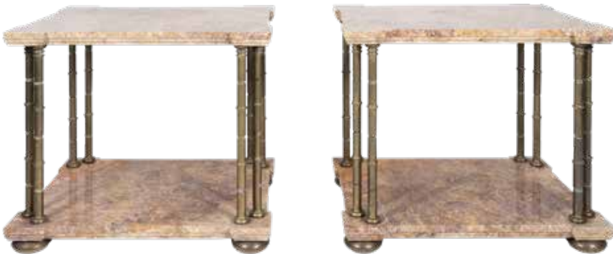
95 COPPIA DI TAVOLINI IN MARMO ED OTTONE Francia, XX Sec. con doppi piani sagomati in marmo, sostegni a colonna, poggianti su piedi a cipolla 61,5x65x50 cm.