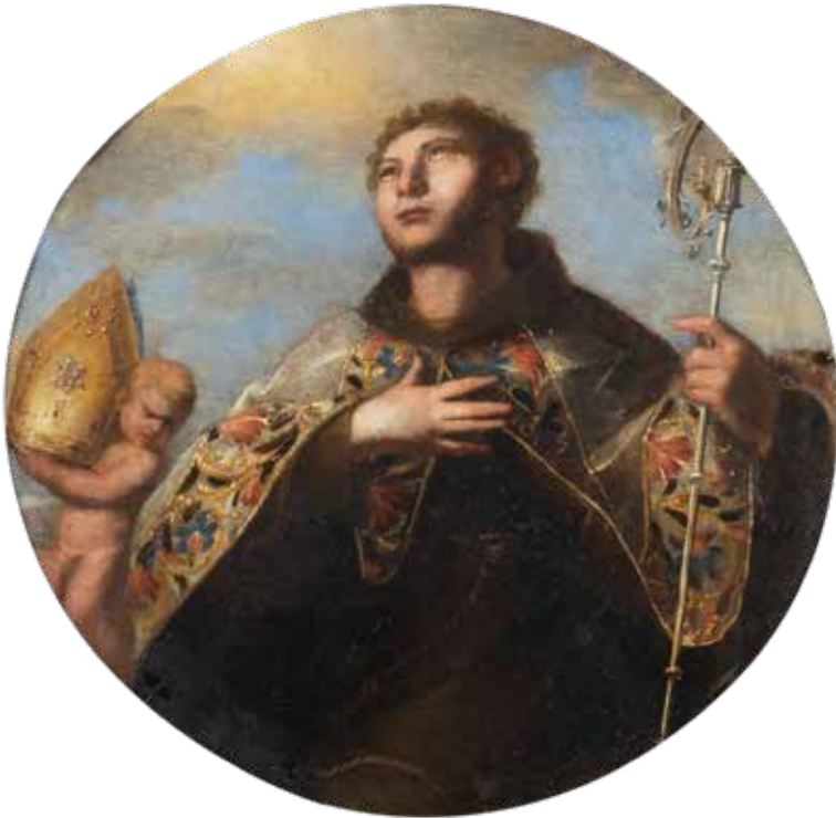
115 SCUOLA NAPOLETANA XVII Sec. "San Gennaro", olio su rame, entro cornice d. 29,5 cm.