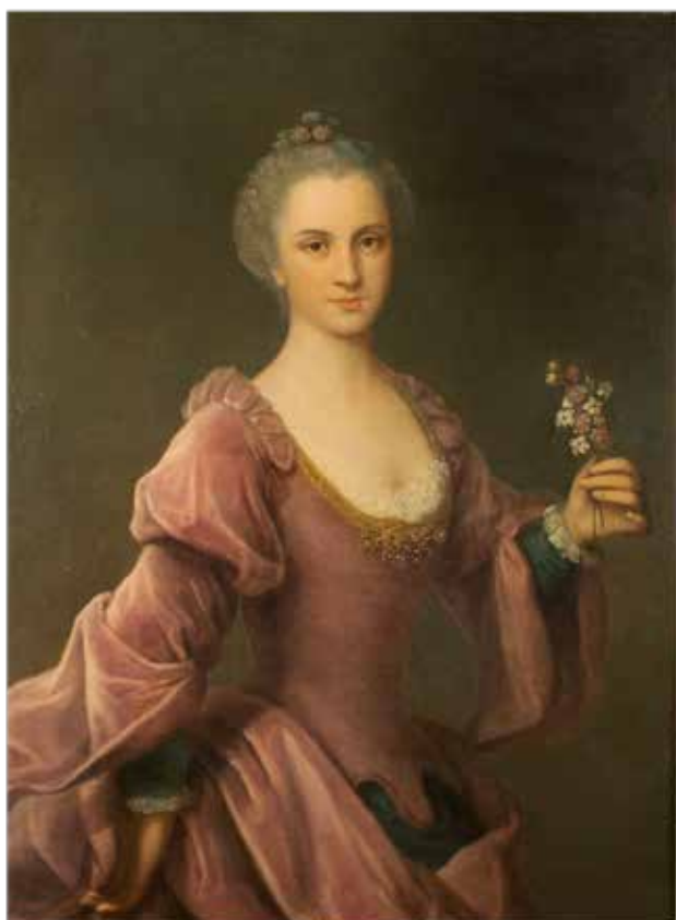
134 SCUOLA FRANCESE XVIII Sec. "Ritratto di gentildonna con fiori", olio su tela, entro cornice 100x75,5 cm.