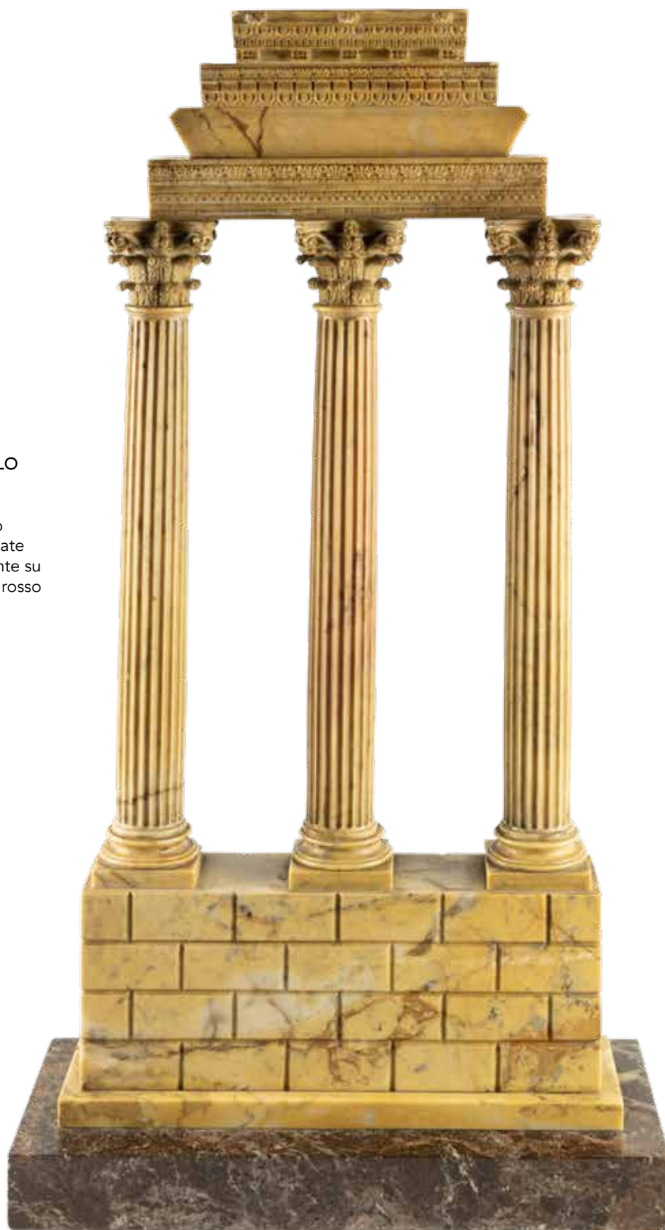
7 GRUPPO IN MARMO GIALLO ANTICO Italia, XIX - XX Sec. raffigurante rovina di tempio classico a tre colonne scanalate con capitelli corinzi, poggiante su base rettangolare in marmo rosso Levanto, usure e lievi mancanze 56x29x12,5 cm.