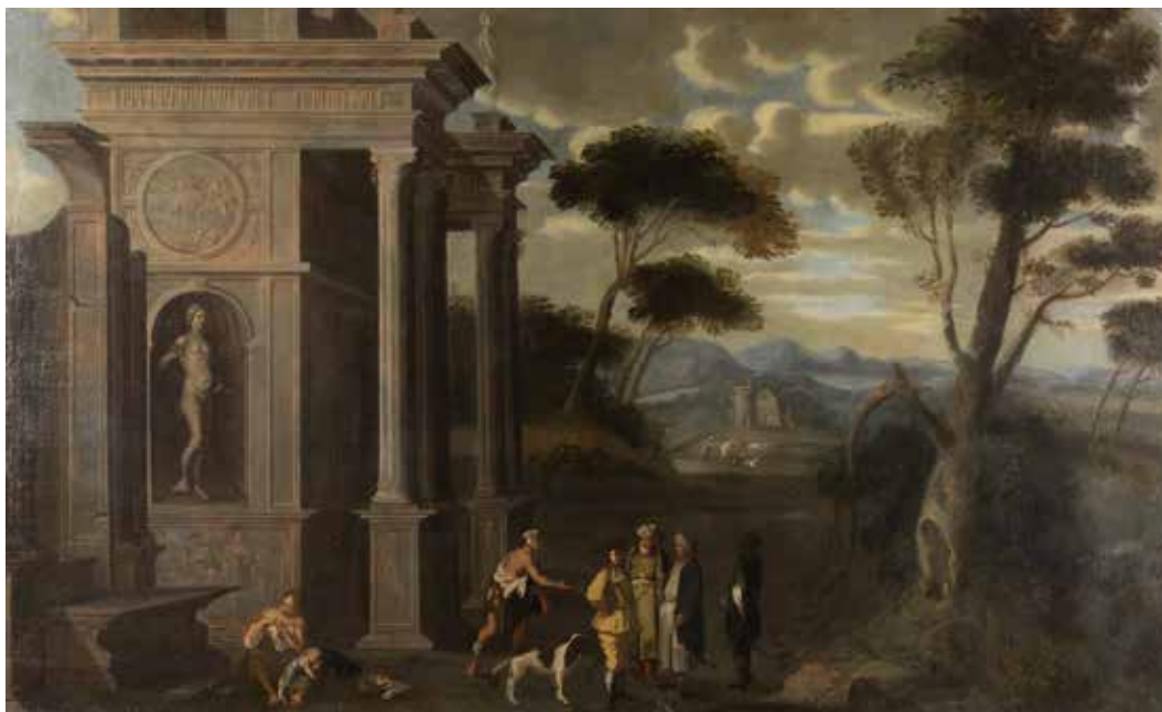
152 PITTORE ATTIVO A ROMA XVIII Sec. "Paesaggio con rovine e figure", olio su tela 81x132 cm.