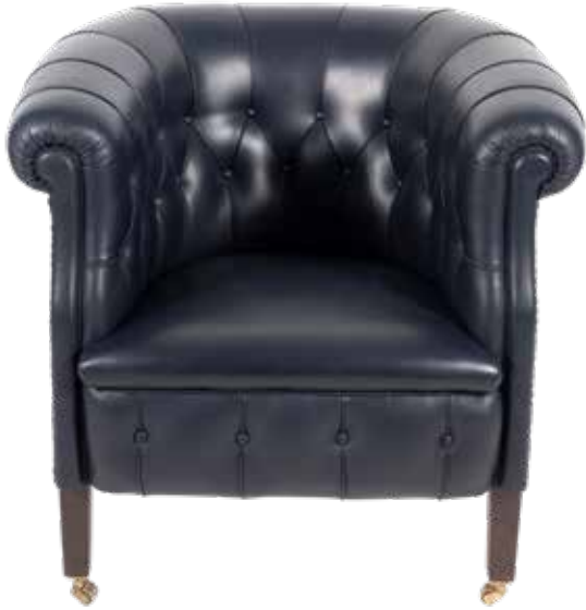
93 RENZO FRAU, PROD. POLTRONA FRAU Italia, XX Sec. poltrona mod. Fumoir in pelle nera e legno, provvista di rotelle anteriori, tiratura limitata n. 1523, etichetta della produzione, segni di usura 78x80x80 cm.