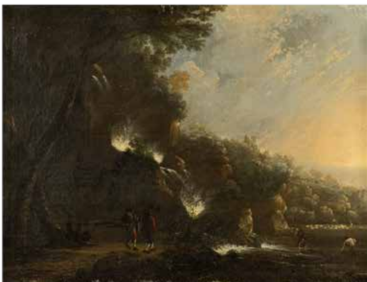
180 SCUOLA FIAMMINGA XVIII Sec. "Paesaggio con cascata e pescatori", olio su tela, entro cornice 49x66 cm.