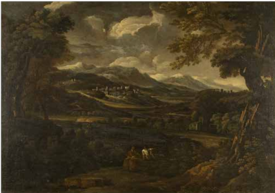
99 GASPARD DUGHET, CERCHIA DI Roma 1615 – Roma 1675 "Riposo dei pastori", olio su tela, entro cornice coeva 72x98 cm.