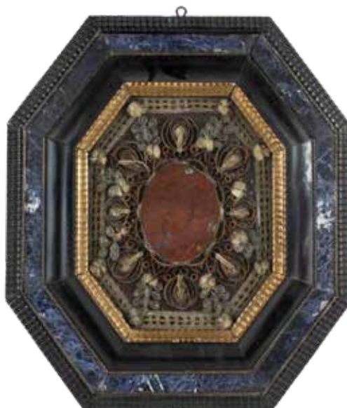
28 COPPIA DI CORNICI PORTA RELIQUIE Trapani, XVIII Sec. in legno ebanizzato e dorato, filigrana di argento, lapislazzulo, pasta vitrea e marmo Diaspro 43,5x38x2,5 cm.