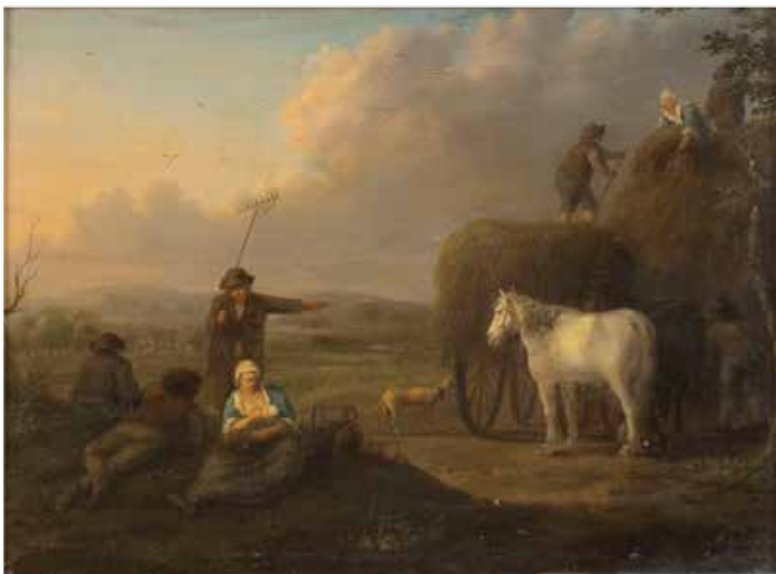
102 SCUOLA FIAMMINGA XVII - XVIII Sec. "Scena di vita contadina con cavallo bianco", olio su tavola, entro cornice 22x28,5 cm.