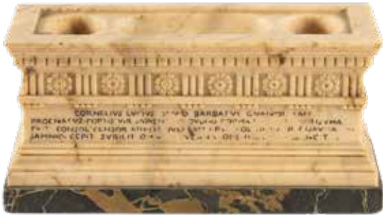
1 CALAMAIO IN MARMO GIALLO ANTICO Italia, XIX - XX Sec. modello del sarcofago di Lucio Cornelio Scipione, poggiante su base rettangolare, lievi usure 7,5x16x5 cm.