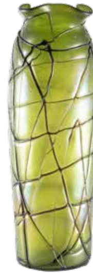
89 VASO ART NOUVEAU IN VETRO IRIDESCENTE Austria, XX Sec. soffiato a mano nella tonalità del verde con applicazioni in pasta vitrea h. 35 cm.