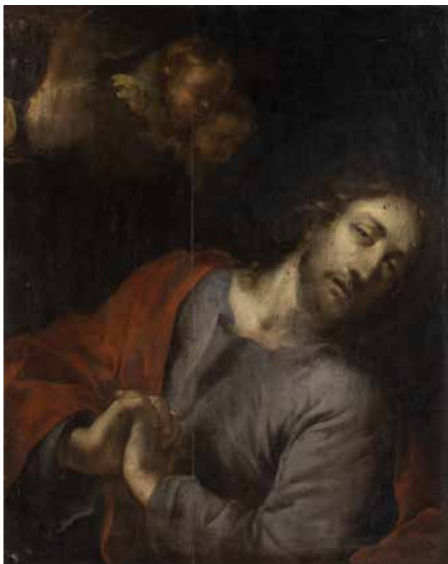
111 PITTORE LOMBARDO XVII Sec. "Ecce homo", olio su tavola 63,5x50,5 cm.