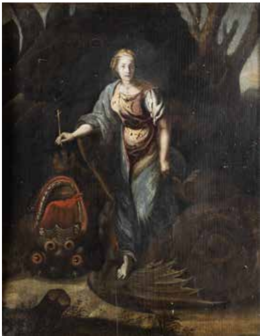
140 RAFFAELLO SANZIO, COPIA DA XVII - XVIII Sec. "Santa Margherita e il drago", olio su tavola, entro cornice 58x44 cm.