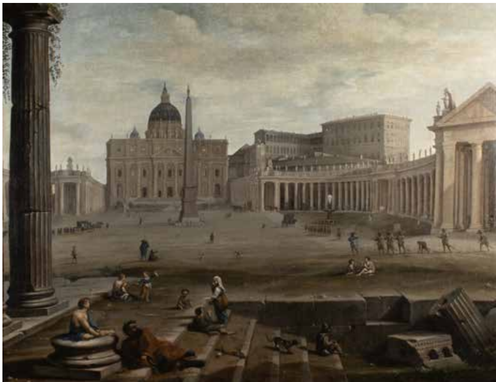
148 JACOB VAN HUCHTENBURGH Haarlem 1644 - Amsterdam 1675 "Veduta di Piazza San Pietro con figure", olio su tela, entro cornice 73,5x96 cm.