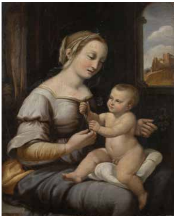
123 RAFFAELLO SANZIO, COPIA DA XVIII - XIX Sec. "Madonna dei Garofani", olio su tavola 37x28 cm.