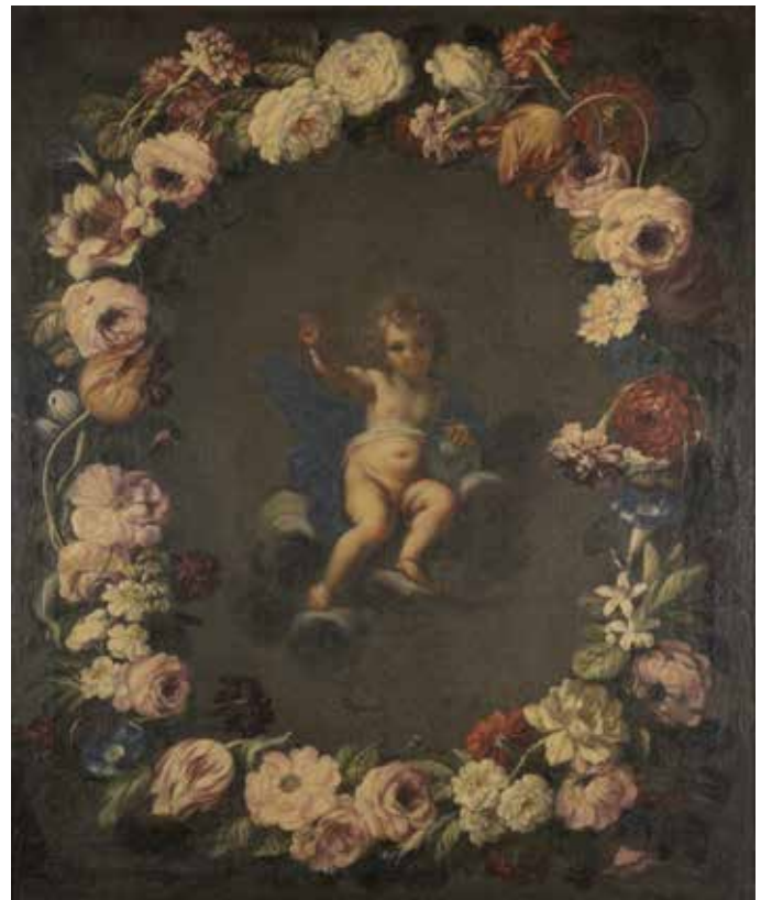
128 MARIO NUZZI DETTO MARIO DEI FIORI, CERCHIA DI XVII Sec. "Bambino Gesù in ghirlanda di fiori", olio su tela, entro cornice 74x62cm.