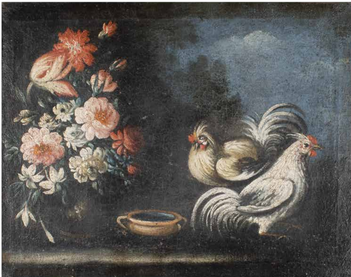
131 SCUOLA NAPOLETANA XVII - XVIII Sec. "Natura morta di fiori con galli e galline", coppia di oli su tela, entro cornici 42x53 cm.