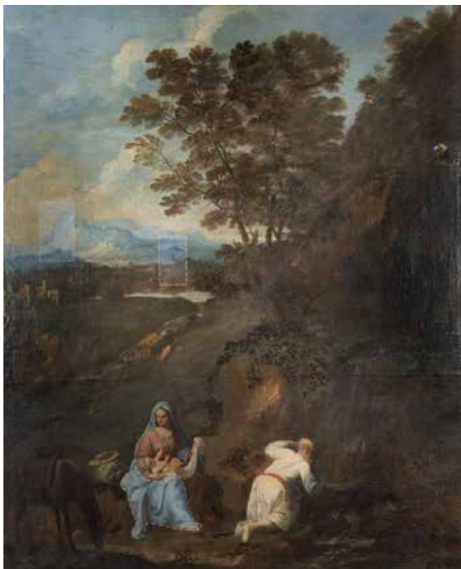
125 GIUSEPPE ZOLA Brescia 1672 – Ferrara 1743 "Il riposo durante la fuga in Egitto", olio su tela, entro cornice 142,5x116,5 cm.