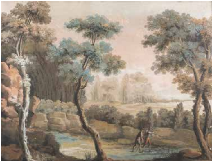
156 PITTORE DEL GRAN TOUR attivo fine XVIII - inizio XIX Sec. "Paesaggio con figure", tempera su carta applicata su tela, entro cornice 44x58,5 cm.